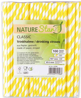
Paille en papier, rayé - jaune / blanc