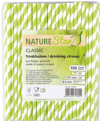
Paille en papier, rayé - vert / blanc