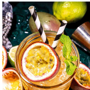
Visuel de référence: présente le produit en utilisation