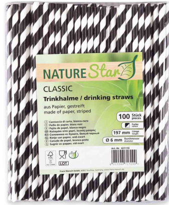
Paille en papier, rayé - noir / blanc