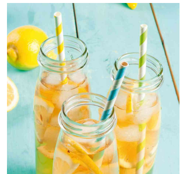
Visuel de référence: présente le produit en utilisation