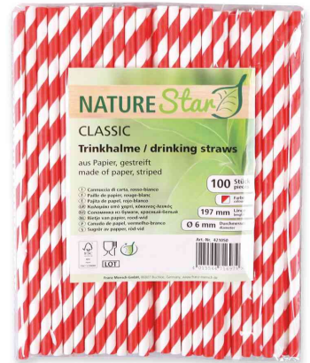
Paille en papier, rayé - rouge / blanc