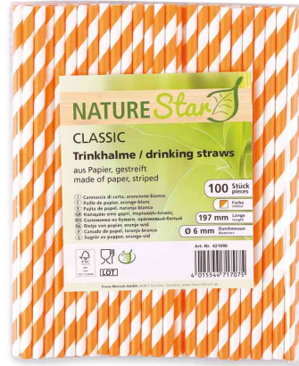
Paille en papier, rayé - orange / blanc