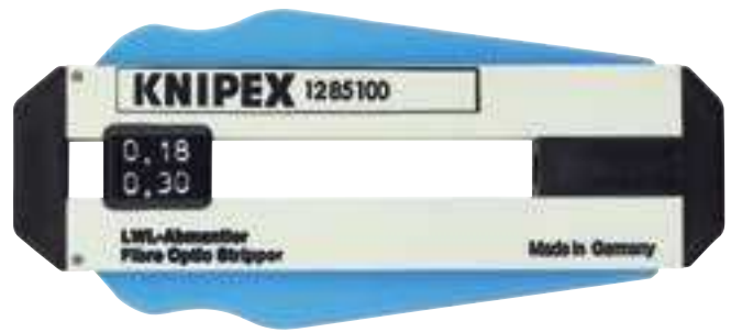
12 85 100 SB