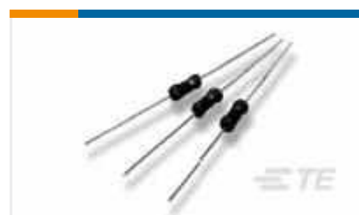
TE Teilnr.:4-1879350-2 RR01 5% 11R AMMO