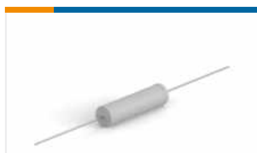
TE Teilnr.:4-2176414-8 7W STD M/OX 5% 1K8