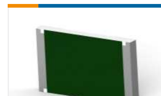
TE Teilnr.:8-2176407-8 3560 27R 5%