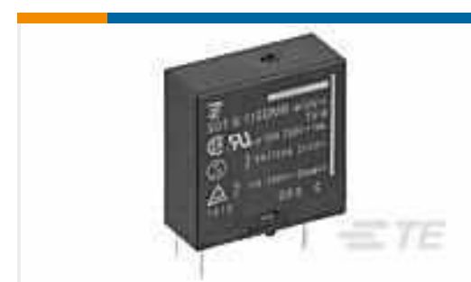
TE Teilnr.:8-1419125-5 SDT-S-106LMR,000