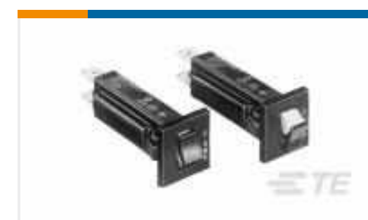
TE Teilnr.:1-1393250-7 W28-XQAT-15=W28