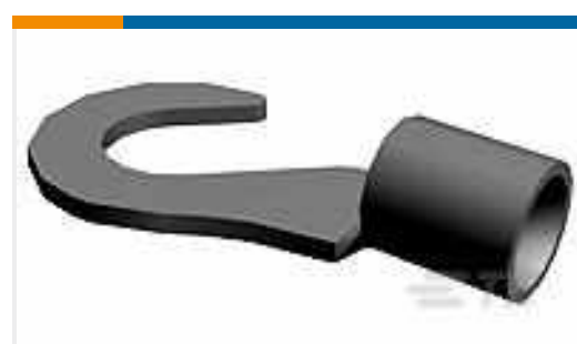
TE Teilnr.:321632 TERMINAL,SOLIS HK 12-10 1/4