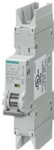
LEITUNGSSCHUTZSCHALTER 10KA, 1-POLIG, C, 15A NACH UL 489 - 277V