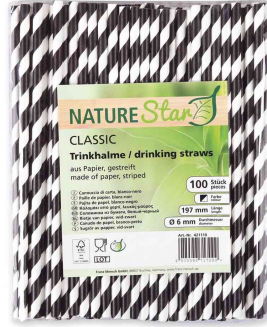
Paille en papier, rayé - noir / blanc