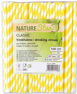
Paille en papier, rayé - jaune / blanc