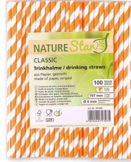
Paille en papier, rayé - orange / blanc