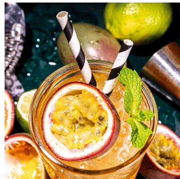
Visuel de référence: présente le produit en utilisation