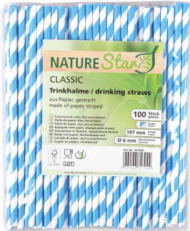
Paille en papier, rayé - bleu foncé / blanc

- idéal pour les cocktails, drinks, limonades et autres boissons rafraichissantes