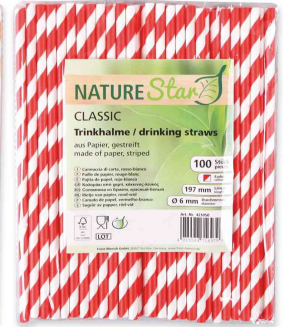
Paille en papier, rayé - rouge / blanc