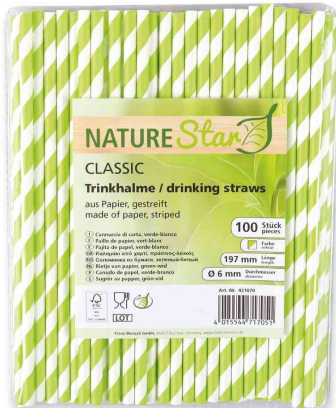
Paille en papier, rayé - vert / blanc