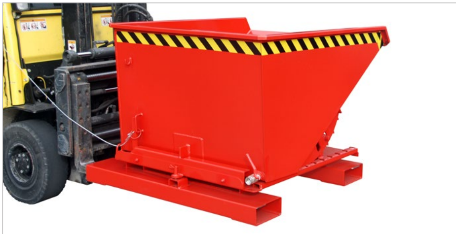
S3S, Kipprichtung nach links