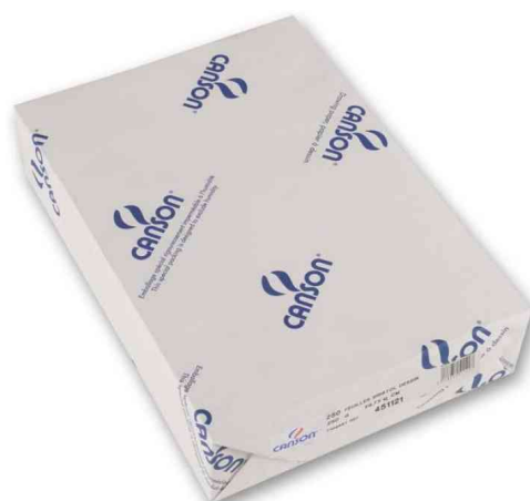
Papier bristol, conditionnement