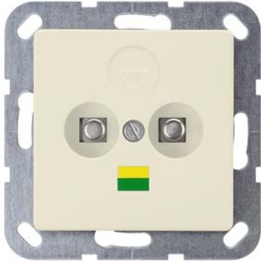
DELTA i-system elektroweiß Doppel-Potential-Ausgleichsdose 55x55mm