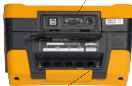
2 Buchsen für Prüfung Referenzwiderstand 10 MOhm