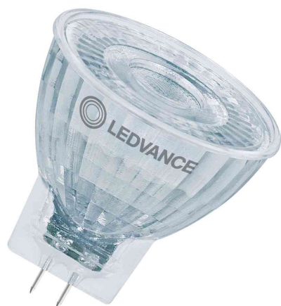
Visuel de référence: Lampe LED MR11 DIM