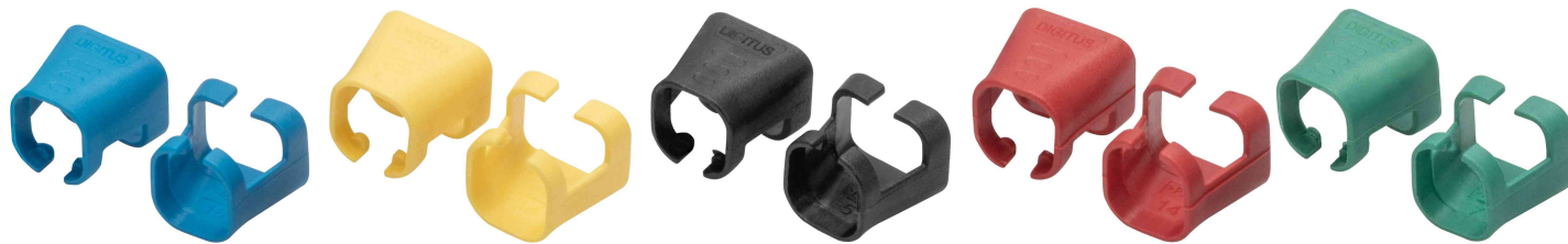
Clip de couleur pour câble patch, bleu