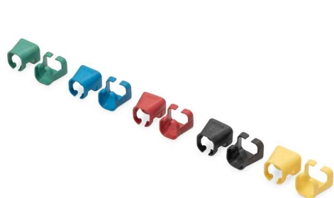
Clip de couleur pour câble patch, assorti