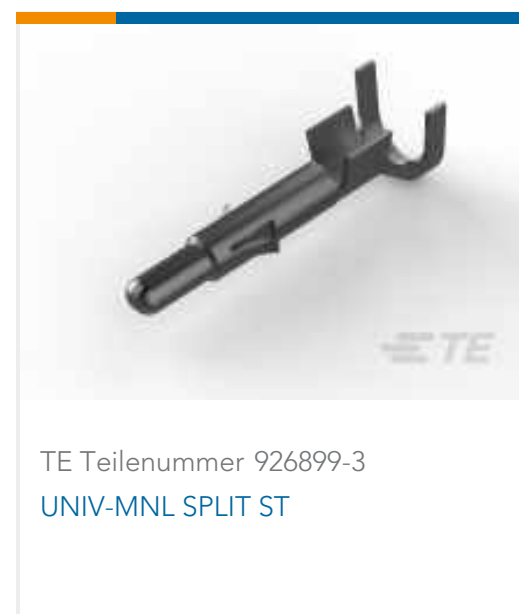
TE Teilenummer 926899-3 UNIV-MNL SPLIT ST