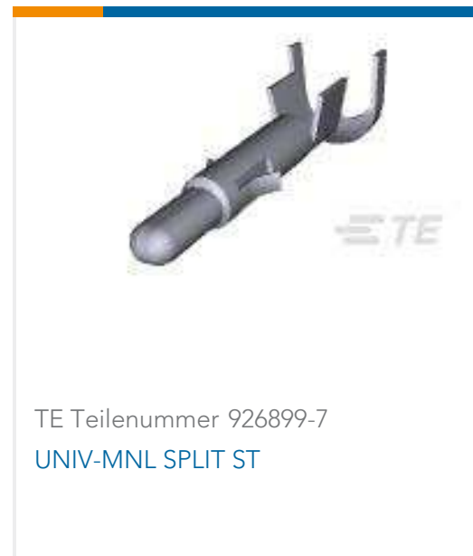
TE Teilenummer 926899-7 UNIV-MNL SPLIT ST