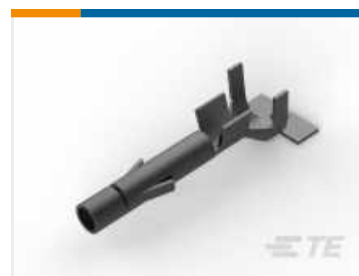
TE Teilenummer 926901-1 UNIV.M-N-L.REC.