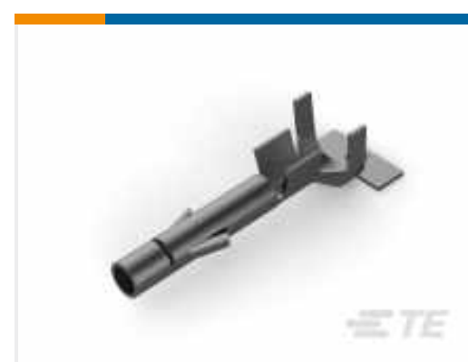
TE Teilenummer 926869-1 UNIV.M-N-L.SOCKET