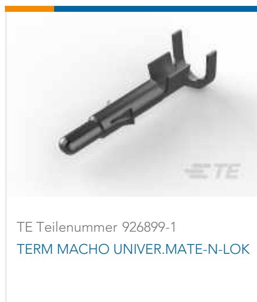
TE Teilenummer 926899-1 TERM MACHO UNIVER.MATE-N-LOK