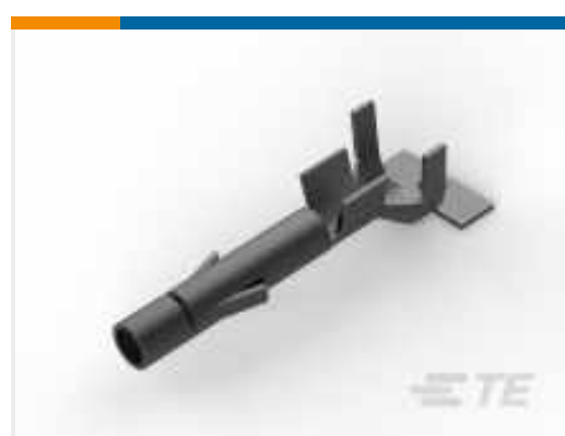
TE Teilenummer 926901-3 UNIV-MNL BUCHSE