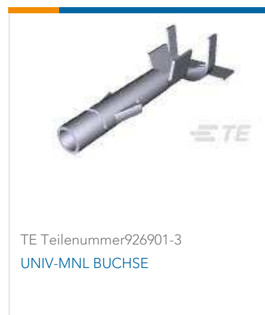
TE Teilenummer 926901-3 UNIV-MNL BUCHSE