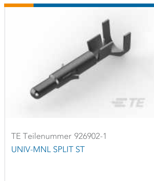
TE Teilenummer 926902-1 UNIV-MNL SPLIT ST