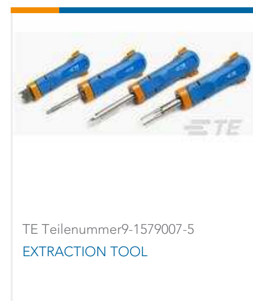
TE Teilenummer 9-1579007-5 EXTRACTION TOOL