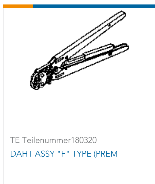
TE Teilenummer 180320 DAHT ASSY "F" TYPE (PREM)