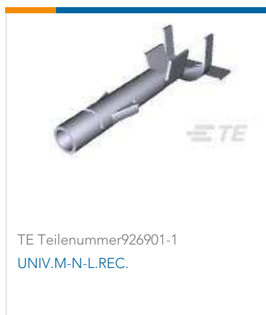
TE Teilenummer 926901-1 UNIV.M-N-L.REC.