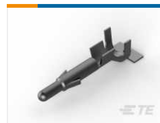
TE Teilenummer 926900-1 UNIV-MNL STIFT