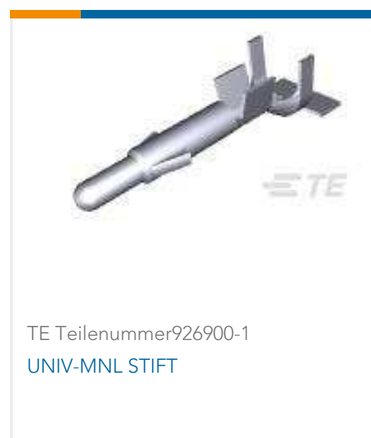
TE Teilenummer 926900-1 UNIV-MNL STIFT