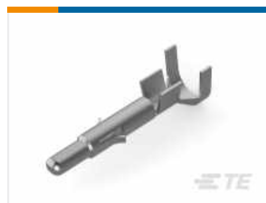
TE Teilenummer 926902-3 UNIV-MNL SPLIT ST