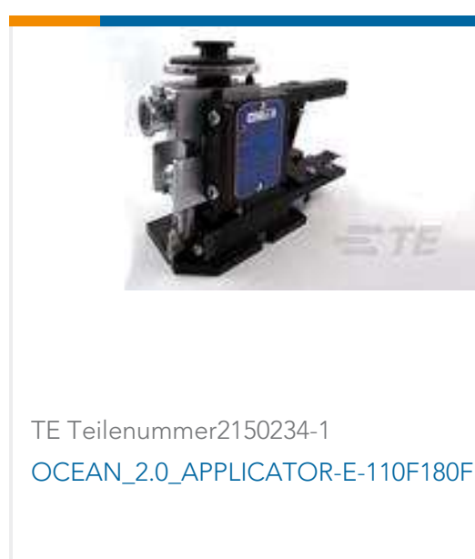
TE Teilenummer 2150234-1 OCEAN_2.0_APPLICATOR-E-110F180F