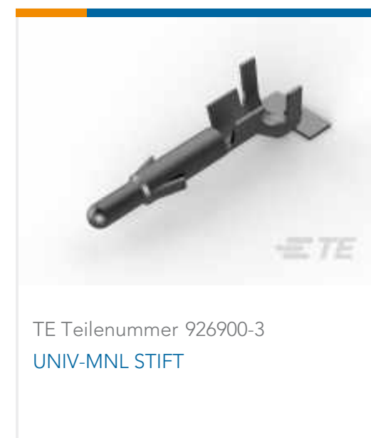
TE Teilenummer 926900-3 UNIV-MNL STIFT