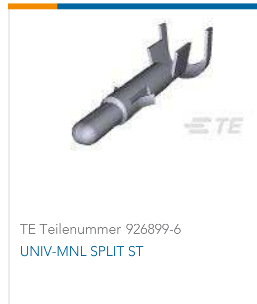
TE Teilenummer 926899-6 UNIV-MNL SPLIT ST