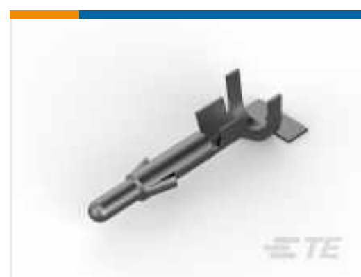
TE Teilenummer 926868-1 UNIV.M-N-L.PIN