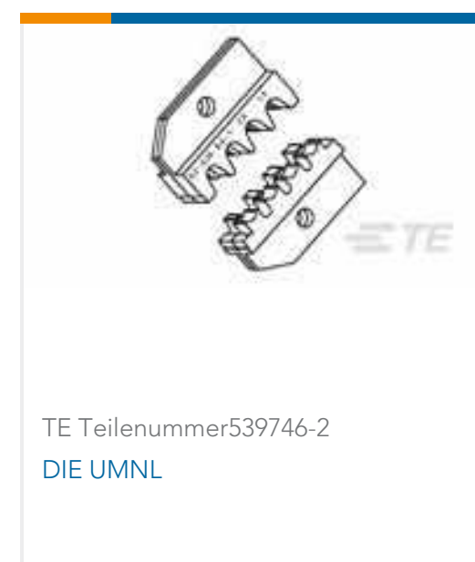
TE Teilenummer 539746-2 DIE UMNL