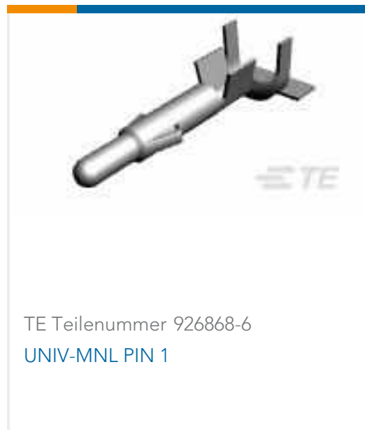
TE Teilenummer 926868-6 UNIV-MNL PIN 1