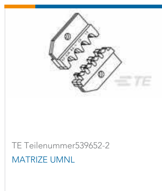
TE Teilenummer 539652-2 MATRIZE UMNL