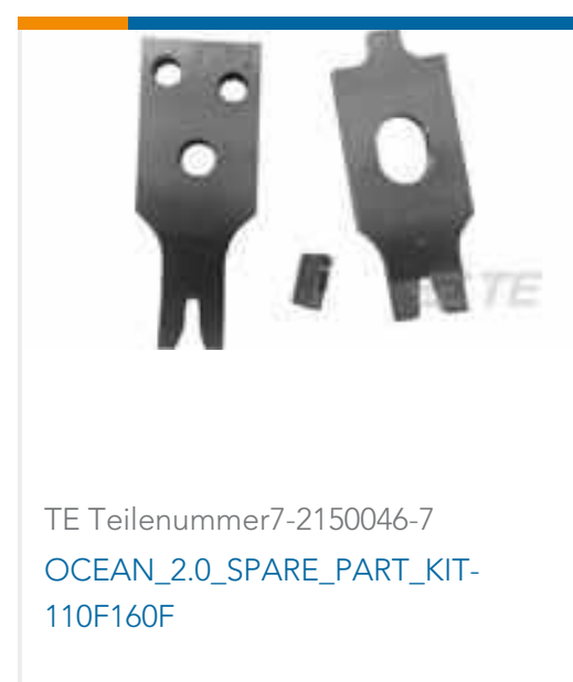
TE Teilenummer 7-2150046-7 OCEAN_2.0_SPARE_PART_KIT- 110F160F