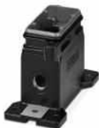
HEAVYCON Sockelgehäuse B6, für Schraubverriegelung, Serie HPR, mit Stützen 2x M20, für erhöhte Umwelt- und EMV-Anforderungen

Bitte beachten Sie, dass die hier angegebenen Daten dem Online-Katalog entnommen sind. Die vollständigen Informationen und Daten entnehmen Sie bitte der Anwenderdokumentation. Es gelten die Allgemeinen Nutzungsbedingungen für Internet-Downloads. ( http://phoenixcontact.de/download )