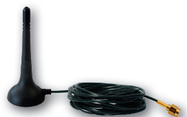
inkl. externer EnOcean-Antenne FA250