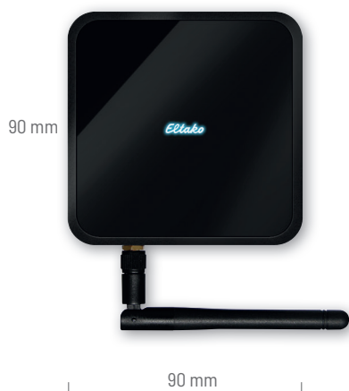
MiniSafe2-REG Professional Smart Home-Controller