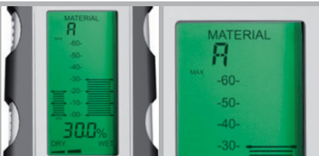
Großes, beleuchtetes LCD-Display