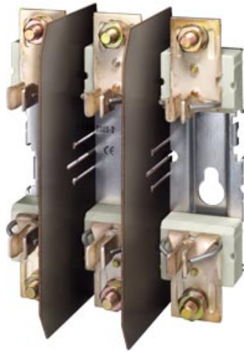
NH-SICHERUNGSUNTERTEIL GR.1, 3POLIG 250A 690V FLACHANSCHLUSS