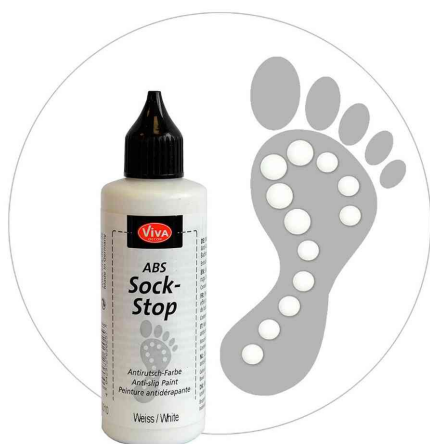
Visuel de référence : Peinture antidérapante ABS Sock-Stop