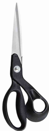
Schneiderschere "Premium Line", schwarz

Auf Scharniere ab und zu einen Tropfen Nähmaschinenöl geben