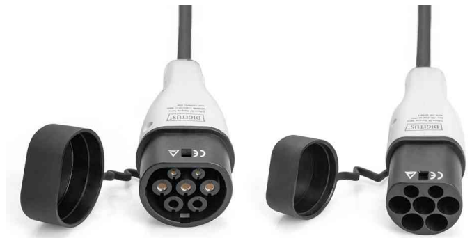
E-Auto-Ladekabel, Typ 2, 3-phasig, Detailansicht Stecker