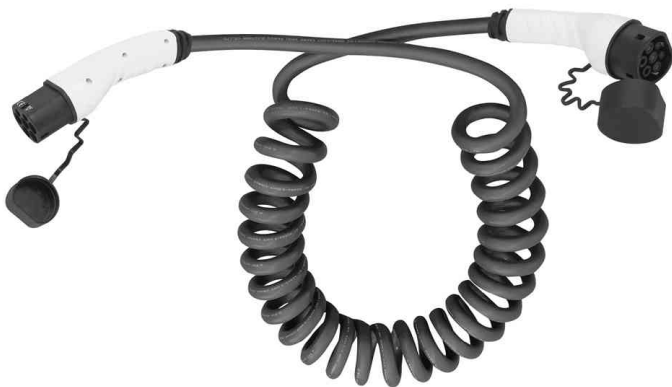
E-Auto-Ladekabel, Typ 2, 3-phasig