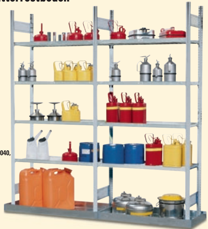
Gefahrstoffregal Typ GRB 1040, bestehend aus Grund- und Anbaufeld

i Alle Regale verzinkt für optimalen Korrosionsschutz