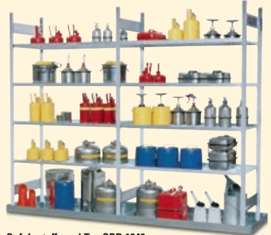
Gefahrstoffregal Typ GRB 1340, bestehend aus Grund- und Anbaufeld