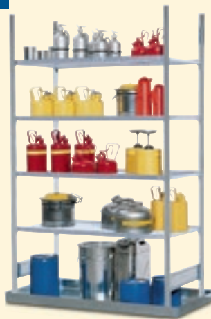
Gefahrstoffregal Typ GRB 1360