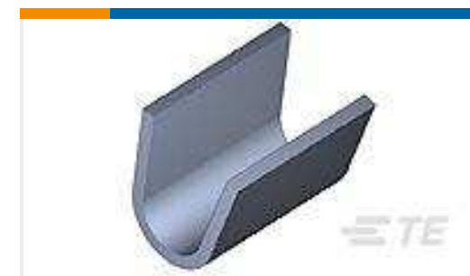
TE Teilnr.:170152-3 AMP SPLICE