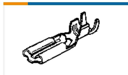
TE Teilnr.:175412-1 PL 110 REC 24-20 AWG 0.25 X 10.4 PTBR