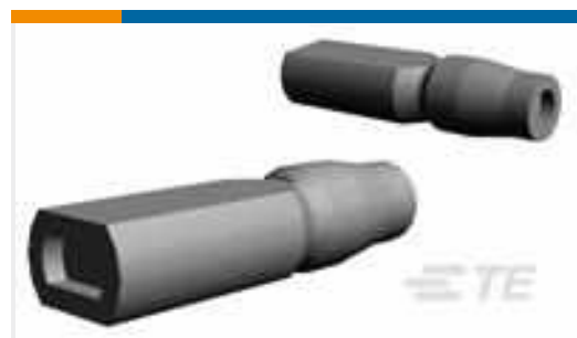
TE Teilnr.:1-170823-3 187 FASTON SLEEVE,REC., TRANSPARENT,NAT