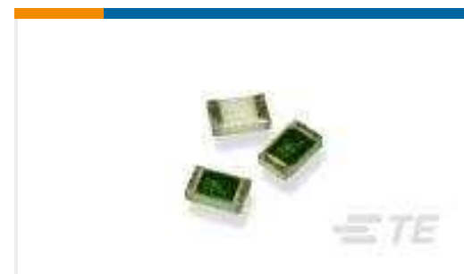
TE Teilnr.:4-1614891-1 CPF 0805 187R 0.1% 25PPM 1K RL