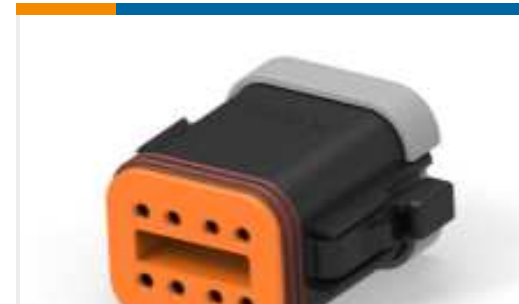
TE Teilnr.:DT06-08SB-C017 PLG, 8P, BLK, BLOCKED, B