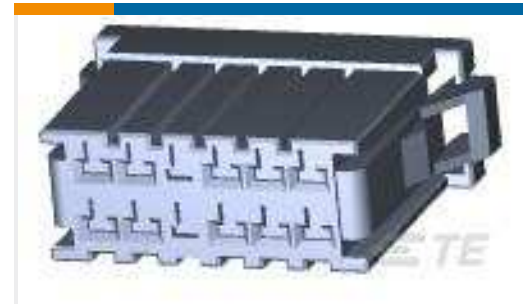
TE Teilnr.:178289-6 DYNAMIC 3100 REC HSG 12P DBL