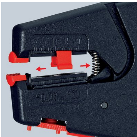
12 40 200: Tope longitudinal ajustable

Reservado el derecho a realizar modificaciones técnicas. Salvo error u omisión.