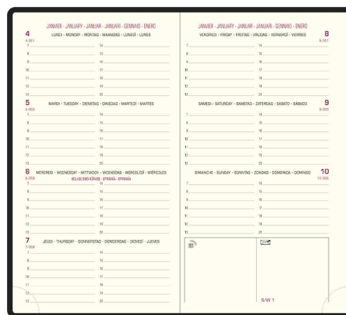
Agenda de poche "Eurotime 16" Cassandra - grille