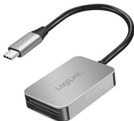
Lecteur de cartes dual USB 3.2 (Gen1)