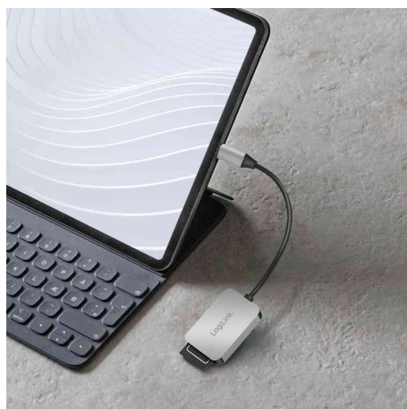
Visuel de référence : montre le produit en utilisation