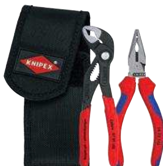
00 20 72 V06