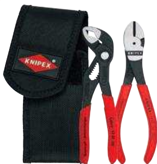
00 20 72 V02