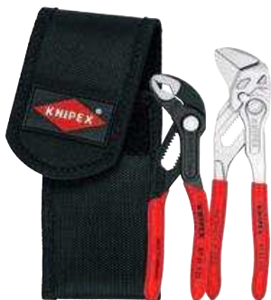
00 20 72 V01