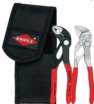
00 20 72 V04