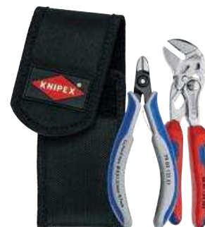
00 19 72 V01