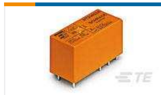
TE Teilnr.:7-1393243-9 RT424730