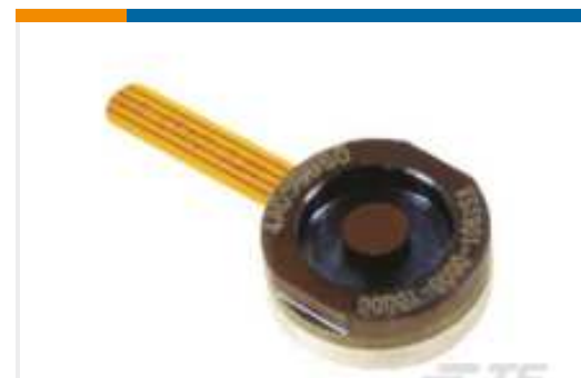
TE Teilnr.:FS1901-0000-1000-G 1000 GRAM FORCE 20MV/V FORCE LOAD CELL