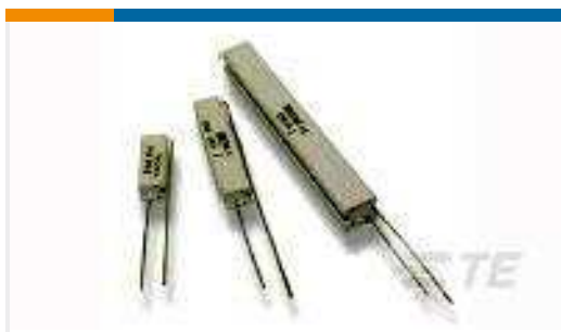
TE Teilnr.:2-1623728-9 BCHE SBCH 11 6R8 5%