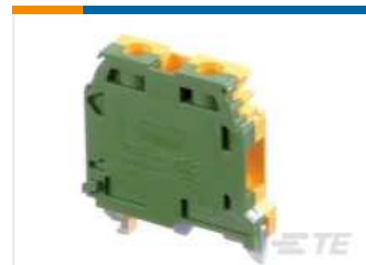
TE Teilnr.:1SNA165115R1000 M10/10.P