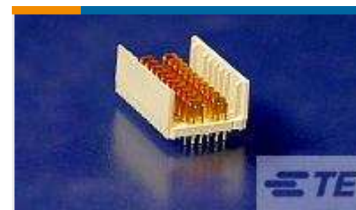
TE Teilnr.:6469025-1 HM-ZD 2PR HDR 40P 2.5MM