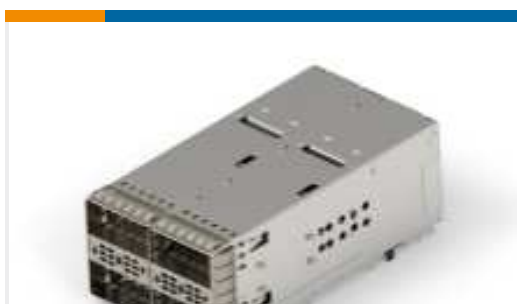
TE Teilnr.:2301859-7 ZQSFP+ STACKED RECEPTACLE ASSEMBLY 2X2