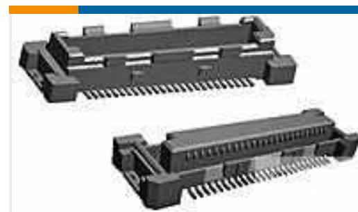
TE Teilnr.:1-5353190-0 .6FHR04H,140,S,GIG,08/Sn,TR,NSYes