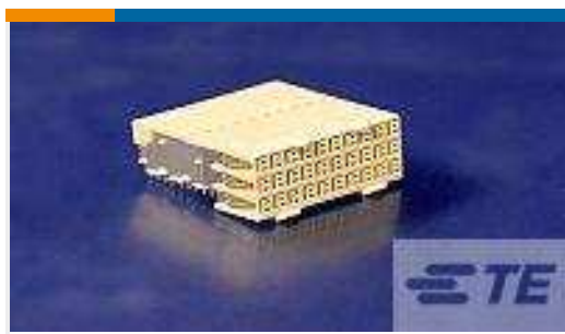
TE Teilnr.: 6469081-2 HMZD 3PR, RECEPTACLE ASSEMBLY