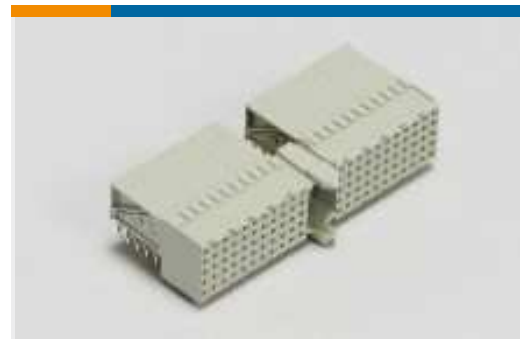
Harte metrische Backplane-Steckverbinder(1)