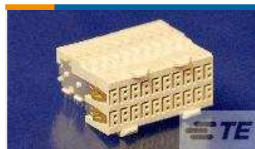
TE Teilnr.:6469028-1 HM-ZD 2PR RECP 40P