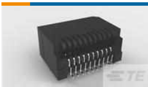
TE Teilnr.:1888247-1 20 POS SMT CONN, SFP/SFP+, 30A