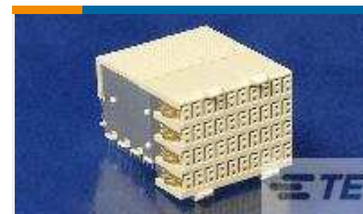
TE Teilnr.:6469001-1 HM-ZD 4PR RECP 80P