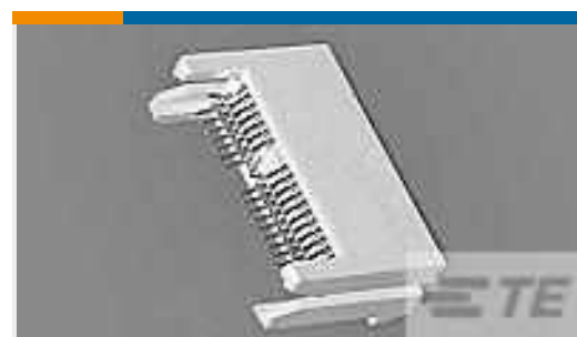
TE Teilnr.:3-1734857-4 PCI EXP STRADDLE 98P WHT 15u"