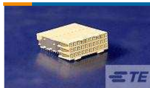
TE Teilnr.:6469081-1 HMZD 3PR, RECEPTACLE ASSEMBLY