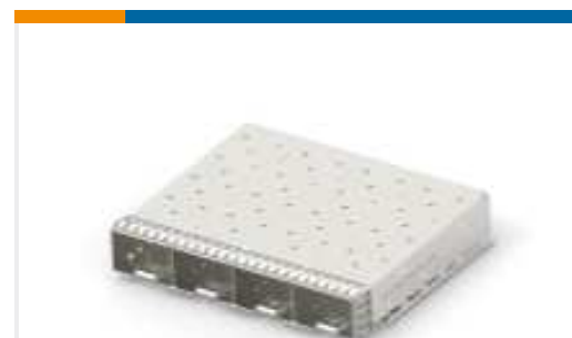
TE Teilnr.:2300275-1 zSFP+ 1x4 Cage Assembly, Press-Fit