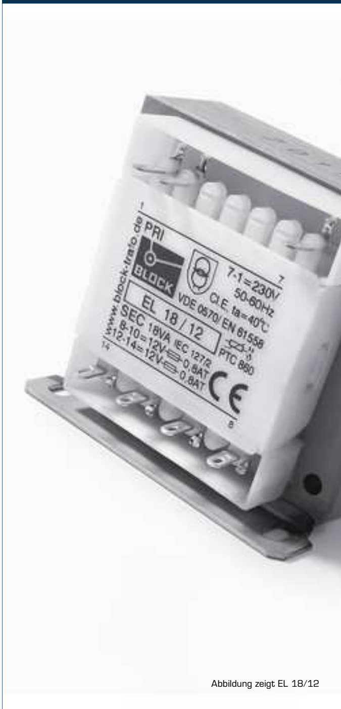
Abbildung zeigt EL 18/12