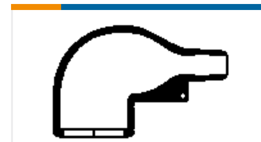
TE Teilenummer369242-000 222K174-25/225-0