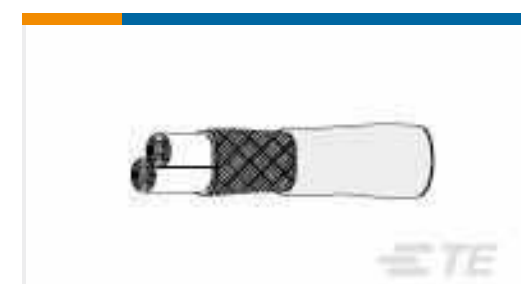
TE Teilenummer3822293013 44A1121-20-0/9-9