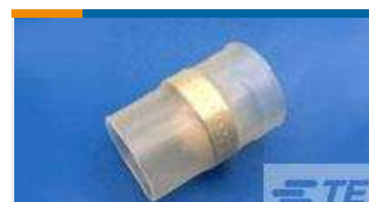
TE Teilenummer696437-000 B-051-00-01