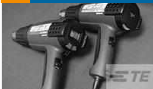
TE Teilenummer CJ2087-000 HL2010E-KIT-120V