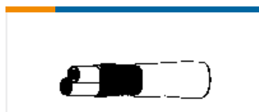
TE Teilenummer CT56603001 55A1121-22-0/9-9-9CK0001