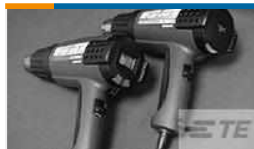
TE Teilenummer CJ2087-000 HL2010E-KIT-120V