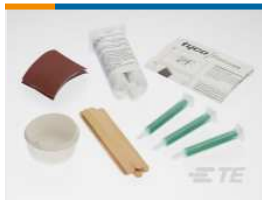
TE Teilenummer 657863-000 S1125-KIT-8