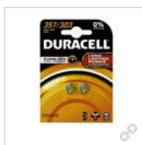
Duracell 357/303 B2 (große Karte)