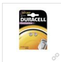
Duracell 357/303 B2 (große Karte)