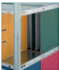
600 mm Regaltiefe für beidseitigen Zugriff