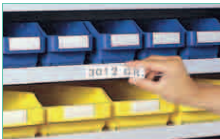
Regal-Kennzeichnung siehe Seite 401.