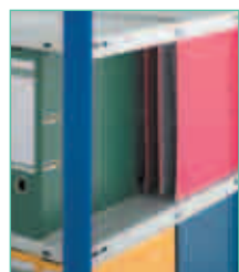
Pfosten wahlweise verzinkt, lichtgrau oder enzianblau