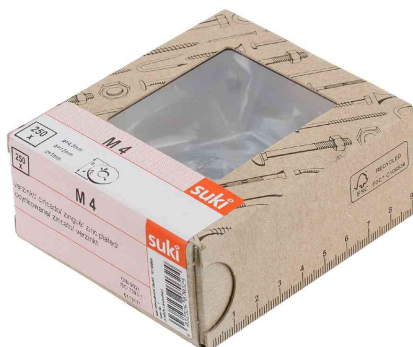
Visuel de référence: rondelle de carrosserie, dans un carton