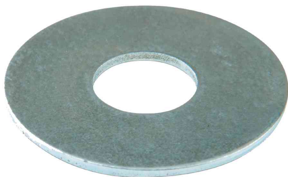
Visuel de référence: rondelle de carrosserie