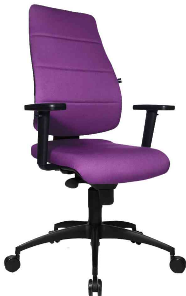
Bürodrehstuhl "Synchro Soft", violett mit optionaler Armlehne Typ H1