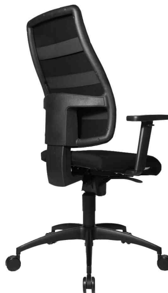
Seitenansicht, mit optionaler Armlehne Typ H1