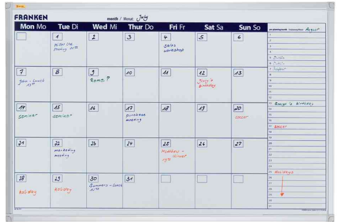
Planungstafel: Monats- oder 7-Tageübersicht