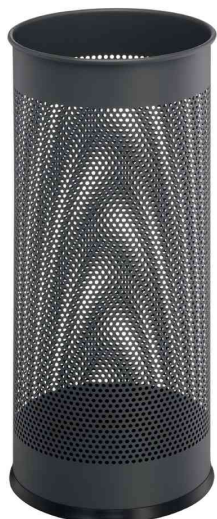
Porte-parapluie en métal, anthracite