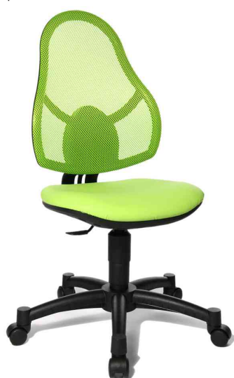
Fauteuil pivotant pour enfant "OPEN ART JUNIOR" vert pomme

- pour enfants et adolescents de 5 à 13 ans