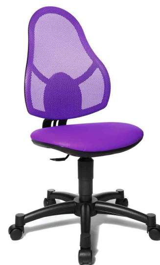
Fauteuil pivotant pour enfant "OPEN ART JUNIOR", violet