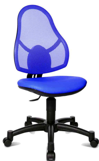
Fauteuil pivotant pour enfant "OPEN ART JUNIOR", bleu royal