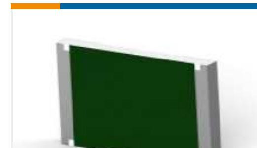
TE Teilnr.:8-2176407-8 3560 27R 5%