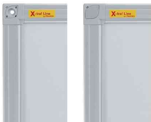
Profil de cadre amélioré avec possibilité de montage invisible