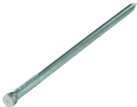
Visuel de référence: pointe, tête d'homme, brute