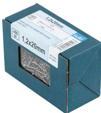
Visuel de référence: pointe, dans un carton