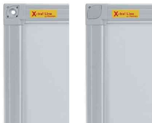
Verbessertes Rahmenprofil mit verdeckter Montagmöglichkeit