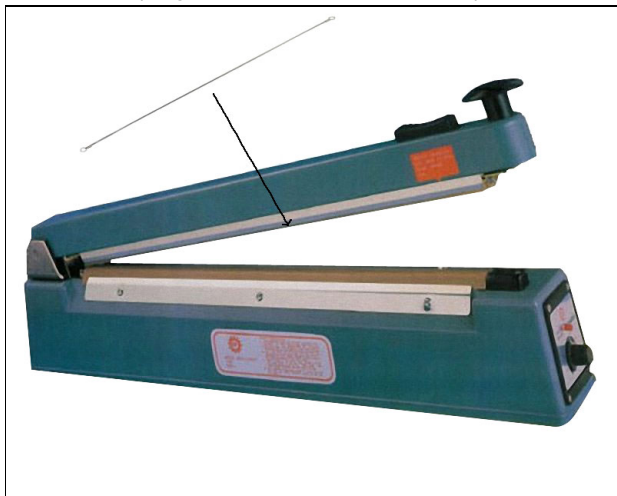
Abb. ähnlich (zeigt EASY-SEAL+ KF-400HC)