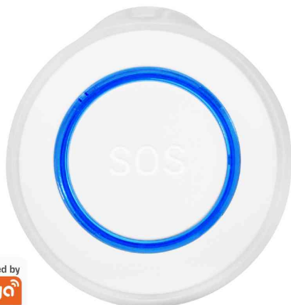
Alarme SOS Smart Wi-Fi