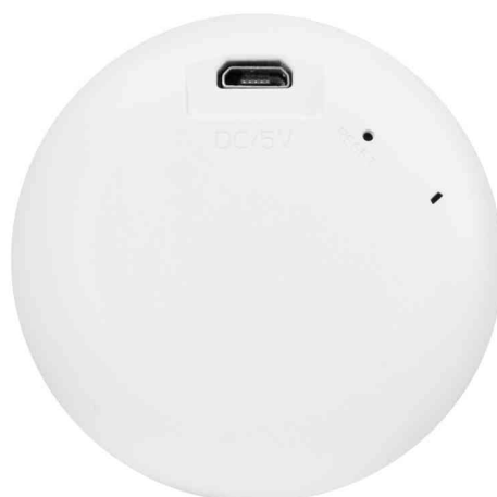
Alarme SOS Smart Wi-Fi, vue de dos