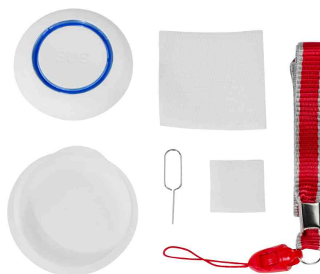
Contenu de la livraison