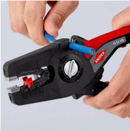
Mit Kabelschneider an der Oberseite bis 16 mm 2