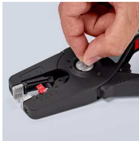
Halbrunde Haltebacken mit Kammprofil für besseren Grip halten praktisch jedes Isoliermaterial sicher fest