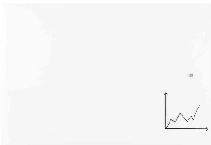
Visuel de référence : tableau inscriptible en verre