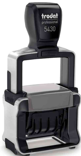
Datumstempel Professional 4.0 5430

Zubehör: Ersatzstempelkissen: VE = 2 Stück auf Blisterkarte, Abgabe nur in ganzen VE's