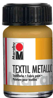
Textilfarbe "Textil Metallic", 15 ml im Glas