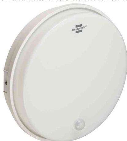
Lampe ronde à LED RL 1650 P