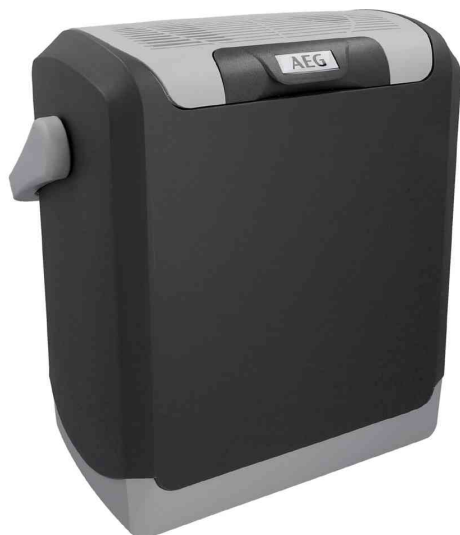
Glacière KK 14